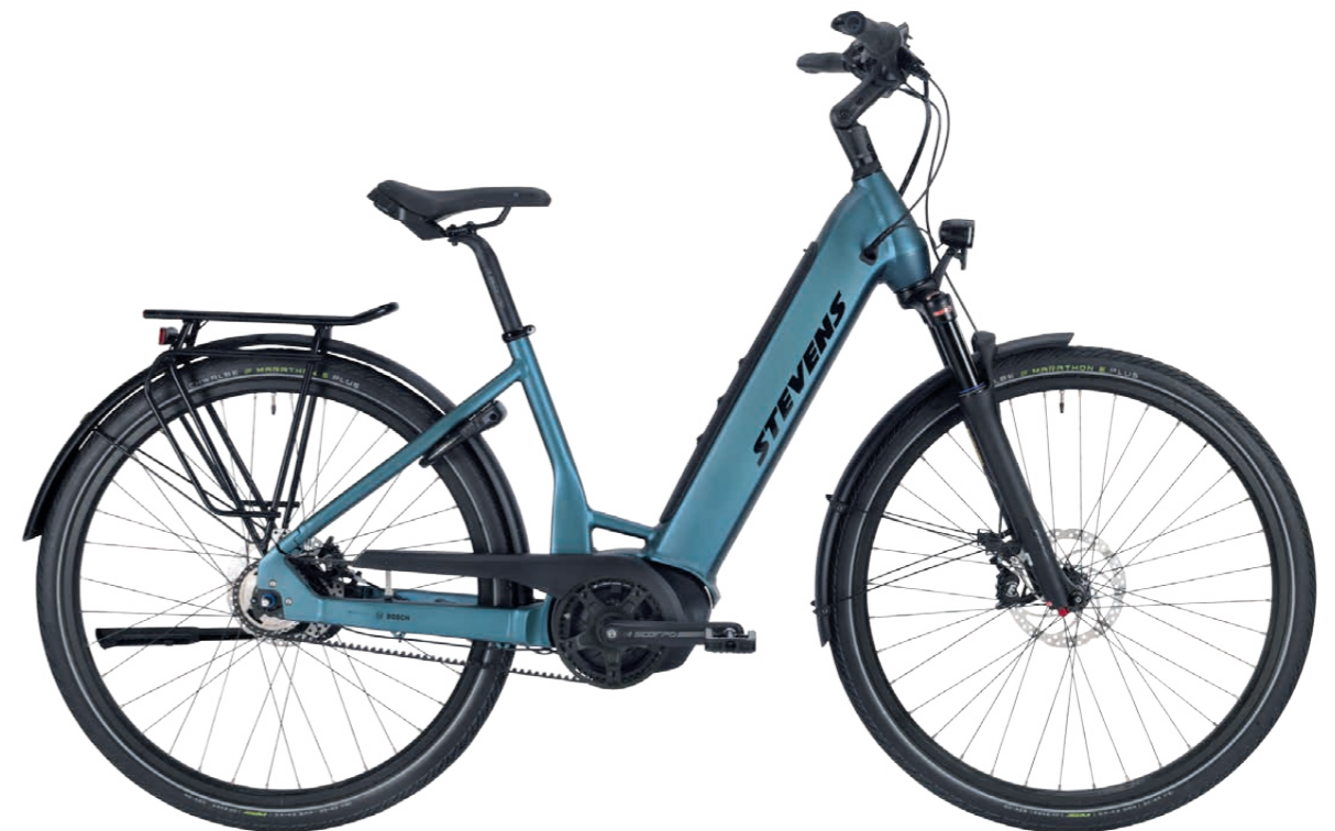
Komfort-Pedelec mit 180 kg zulässigem Gesamtgewicht // Leiser Bosch Performance 65Nm Antrieb & 625Wh-Akku // Geschmeidige 5-Gang-Nabenschaltung & Zahnriemen Alle Informationen auf stevensbikes.de/e-courier- und bei rund 500 STEVENS Händlern in Deutschland.