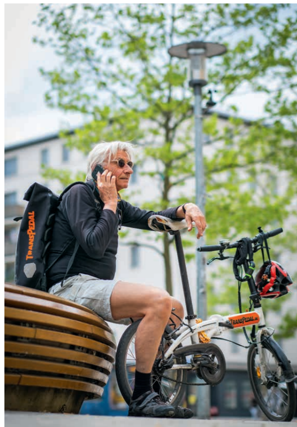
Kurierleben 2020: Das Smartphone ersetzt Pager und Funk

Der orangefarbene Magnet markiert den Abholort eines Auftrags. Dass die meistens in der Innenstadt liegen, sieht man dem Stadtplan an